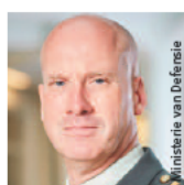
Dhr. luitenant-generaal M.H. (Martin) Wijnen Plaatsvervangend Commandant der Strijdkrachten bij het ministerie van Defensie