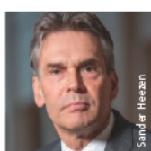
Dhr. drs. H.W.M. (Dick) Schoof Directeur-Generaal Algemene Inlichtingen- en Veiligheidsdienst (AIVD)