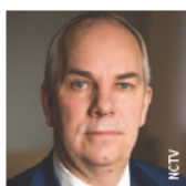
Dhr. P.J. (Pieter-Jaap) Aalbersberg EMPM (covoorzitter) Nationaal Coördinator Terrorisme- bestrijding en Veiligheid (NCTV)