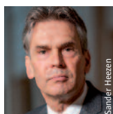
Dhr. drs. H.W.M. (Dick) Schoof Directeur-Generaal Algemene Inlichtingen- en Veiligheidsdienst (AIVD)